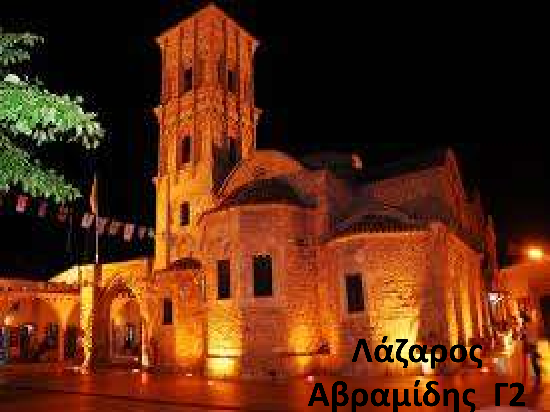
Λάζαρος Αβραμίδης Γ2