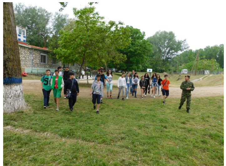
Ο Διοικητής της μονάδας ξεναγεί τους μαθητές μας...

Μας καλωσορίζουν. Λίγα τα λόγια τους. Τεράστια η πίστη τους σε ό,τι κάνουν.